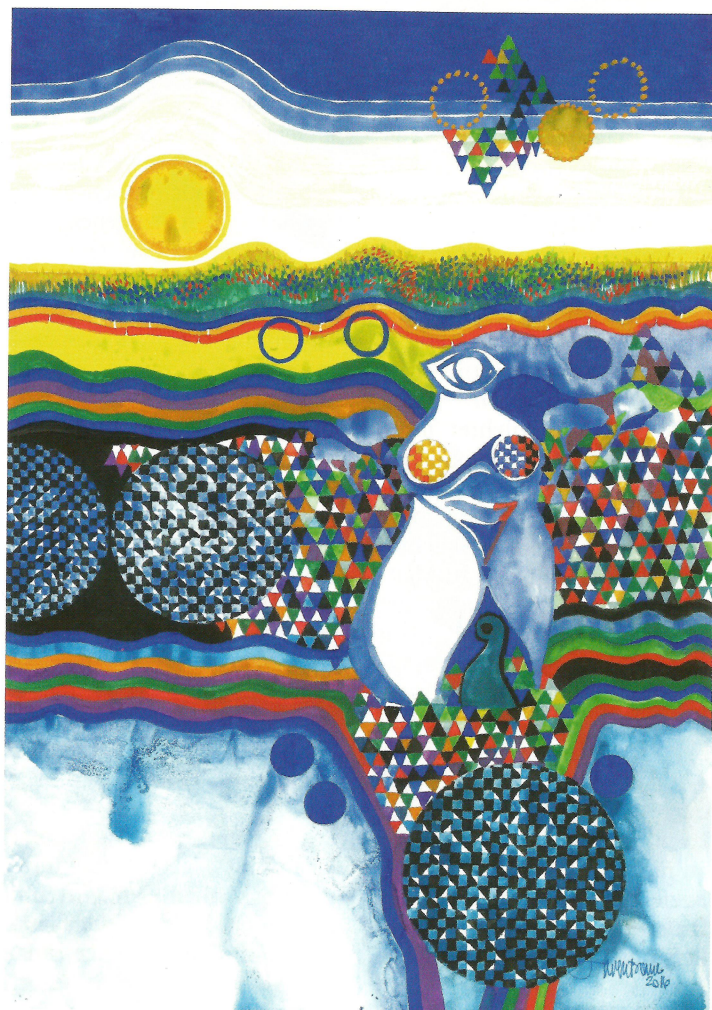
li.: Die Zeichnung „Erzherzog Johann“ oben: Panonia V.